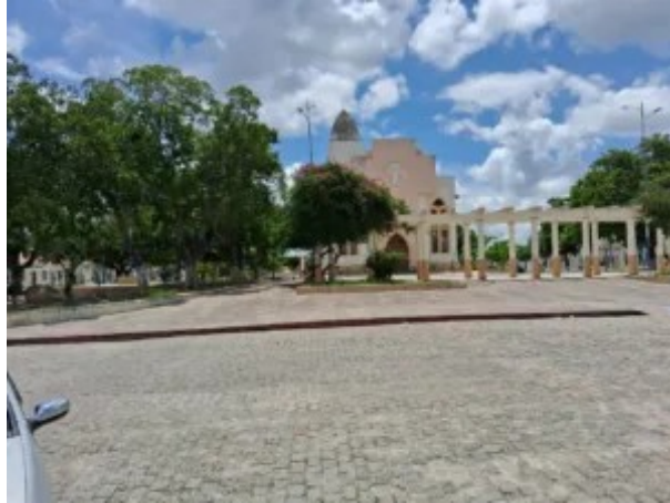
Gilmar Fotografias & História LTDA.

À distância, as luzes pareciam estrelas que descansavam sobre a terra.