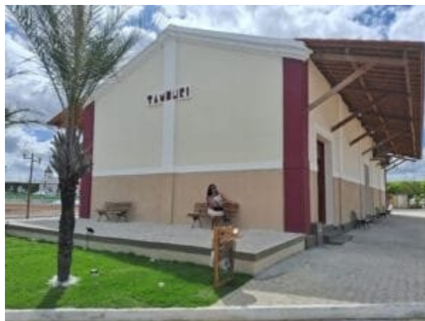
Estação Ferroviária reformada em Marcionílio Souza, Bahia